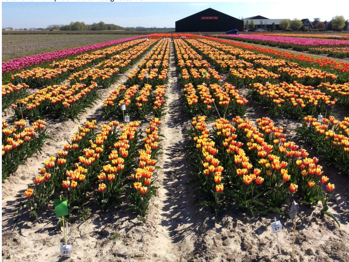
Foto. Overzicht proefveld Jan Seignette klei