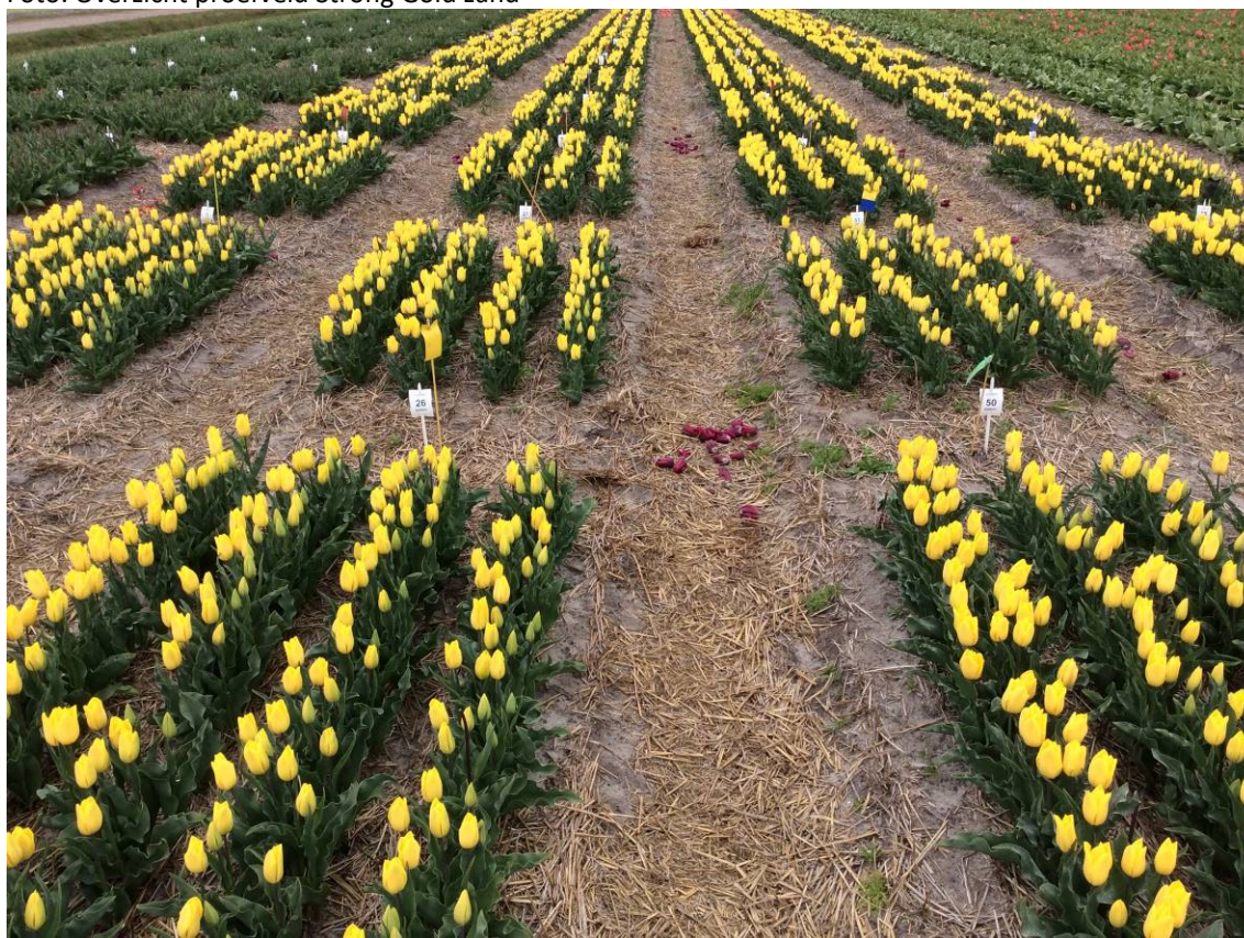
Foto. Overzicht proefveld Strong Gold zand

Wekelijks 0,5 l/ha Human. Gewasbespuiting op basis van BOS. Bolontsmetting 50% chemie.