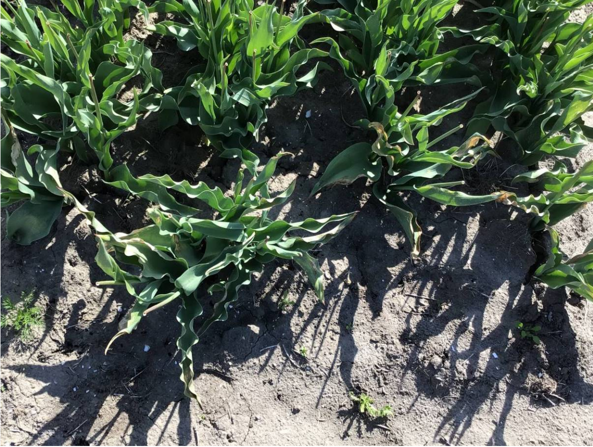
Foto. Schadebeeld bladpunten