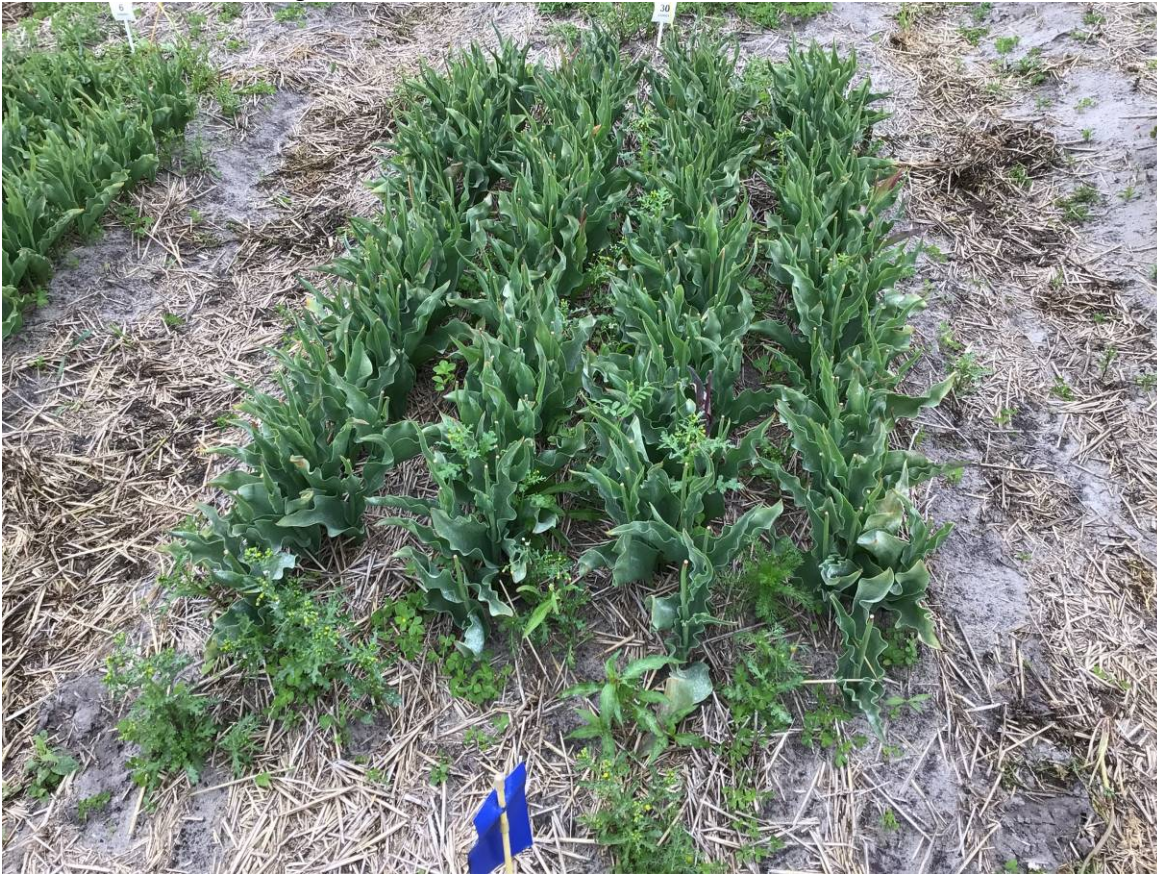
Foto. Standaard GBM 'Strong Gold'